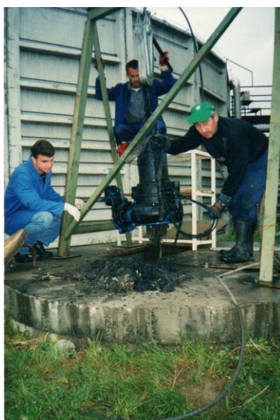
Slika 3. Zastoj na pumpnoj stanici - plivajuće materije u sistemu javne kanalizacije

Mješoviti tip komunalne otpadne vode koji se prečišćava na PPOV Srebrenik, osim abrazivnog materijala i plivajućih materija sa sobom nosi i velike količine onečišćene vode ulične kanalizacije koja se prečišćava bez prisutnosti finansijske obaveze plaćanja.