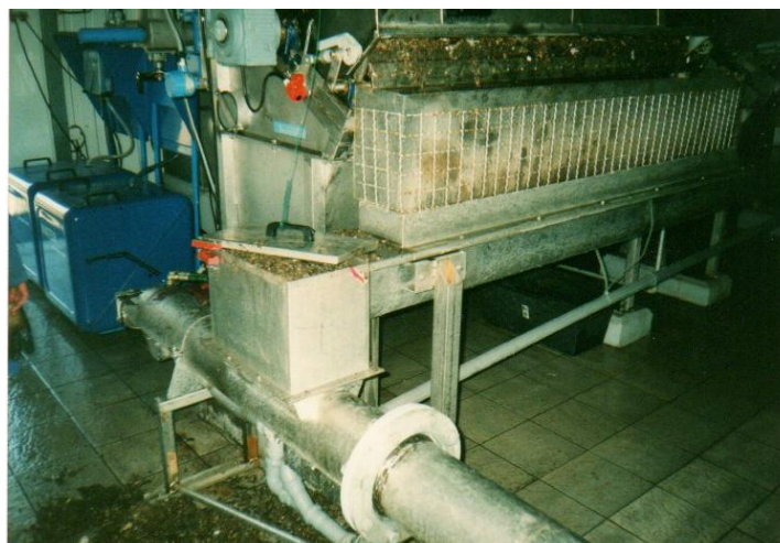
Slika 2. Zastoje na mikrositima - uzrok abrazivni materijal.

Problem plivajućih materija u kalizacionim kolektorima, pa dobrim dijelom naša "kultura" ispuštanja otpadnih voda u sistem javne kanalizacije uzrokovao je u probnoj fazi česte zastoje na pumpnoj stanici zbog pojave različitih vrsta plivajućih "materija" u otpadnoj vodi.