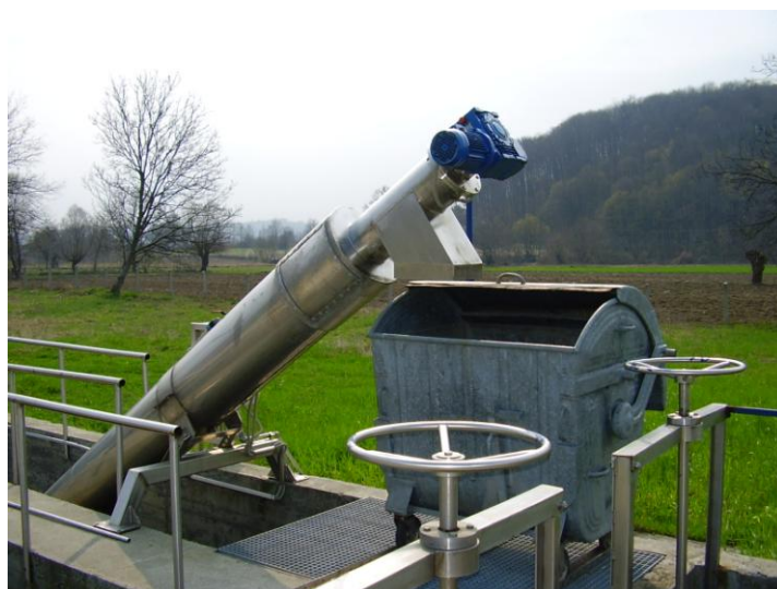
Slika 1. Roto sito sa mehaničkom rešetkom.